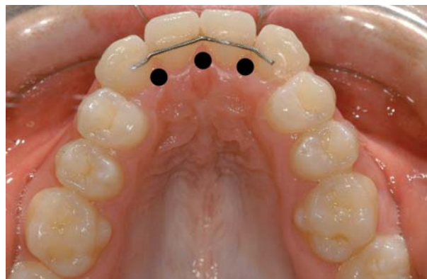
Abb. 2: Schlechtes Beispiel für einen OK-Retainerdraht. Verseilter nickelhaltiger Edeldraht.