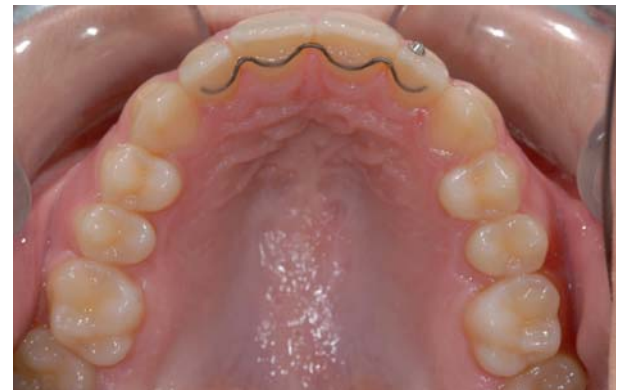
Abb. 6: OK 2x2 TMA-Retainer (Ormco, .018 inch) mit vier Klebestellen nach mehreren Monaten in situ. Kleber: Transbond LR (Unitek) licht-härtend.