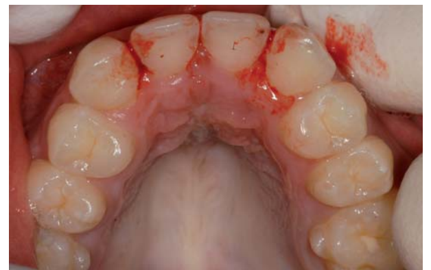
Abb. 3: Nach mühsamer Entfernung des Retainers aus Abb. 2: Gingivitis, entkalkte Klebestellen (Patient für Second Opinion/Treatment).