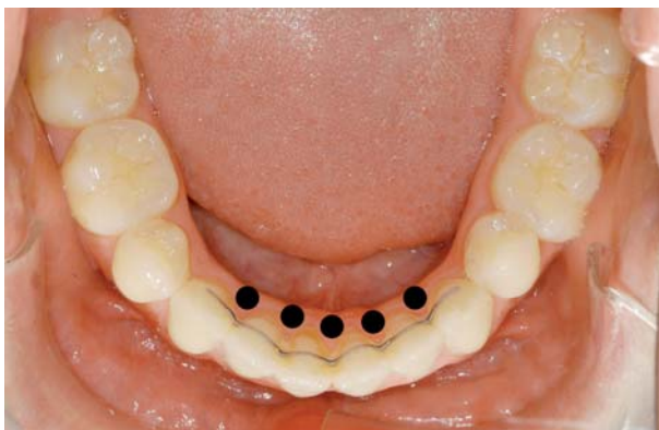
Abb. 1: Schlechtes Beispiel für einen UK-Retainer: 6 Klebestellen, Interdentalräume mit Zahnstein und Kleber behaftet (schwarze Punkte), Reinigung kaum durchführbar, potenzielle Gefahr, dass sich unbemerkt eine Klebestelle löst. Material: Verseilter Edeldraht (Nickel-Chrom).

mündlich und schriftlich mitgeteilt, ist unerlässlich. Es ist zu beachten, dass bei den UK-Retainern, die an allen Frontzähnen gebondet sind, der Patient nicht bemerken kann, ob sich eine Klebestelle gelöst hat, daher müssen diese Retainertypen unbedingt regelmässig überprüft werden. UK-Retainer, nur an den Eckzähnen geklebt, haben den Vorteil, dass sich beim Lösen einer Klebestelle der Draht im Munde bewegt. Dies wird vom Patienten als störend empfunden und er meldet sich in der Praxis. Überdies muss der zuweisende Familienzahnarzt über Art, Material und Verweildauer der fixen Retainer in-