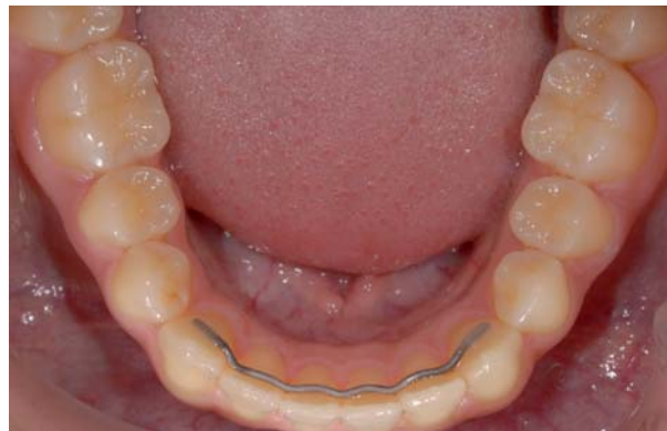
Abb. 5: 3x3 UK TMA-Retainer (Ormco, .027 inch) mehrere Monate in situ: Nur an den Eckzähnen geklebt (zwei Klebestellen). Reinigung mit Zahnseide möglich.